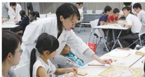
■実験教室のようす

2015年3月設立。本社・山形県鶴岡市。腸内環境をデザインするリーディングカンパニー。慶應義塾大学および東京工業大学の研究分野で培われた確かな解析技術、メタボローム解析とメタゲノム解析をもとに腸内環境を評価し、健康維持に有益な情報を提供することで病気ゼロの社会を目指す。当社とメタジェンは、2015年7月よりメタジェンの持つ独自の解析技術「メタボロゲノミクス™」を用いて、世界初となる生きたまま腸に届いたビフィズス菌がヒトの腸内環境に与える影響について、その詳細を明らかにする初の共同研究をスタートしました。