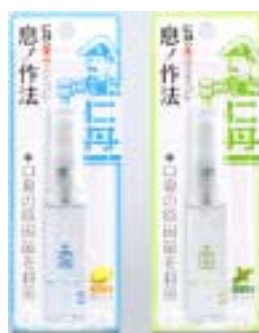
「仁丹の薬用マウススプレー レモン/ペパーミント」