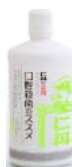
「仁丹の 薬用デンタルリンス」