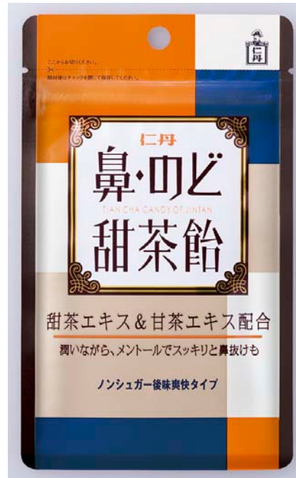
「仁丹の鼻・のど甜茶飴」 価格:315円(税込み) 内容量:1袋(38g)