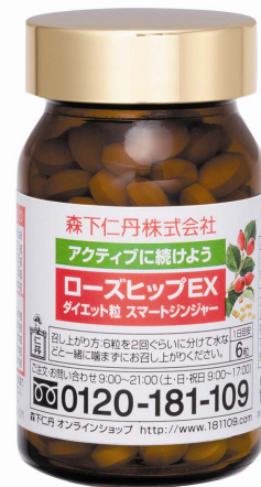
ローズヒップEX ダイエット粒 スマートジンジャー 価格:5,460円(税込み) 内容量:180粒

パッケージは、通信販売専用の商品ということを踏まえ、インパクトや見栄えのよさというよりも、お客様のお手元に届いた後の利便性を重視して制作しました。商品名や飲用方法、困ったときのお問い合わせ先などを、わかりやすいようにパッケージや商品に大きく入れています。今後は、この基本デザインをその他の森下仁丹の通信販売専用商品に適用しています。