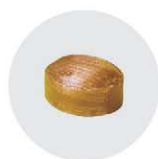
【内容量】38g 【希望小売価格】463円(税抜)