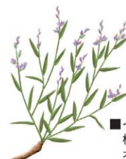
■ イトヒメハギ 根を乾燥させたものが オンジです。