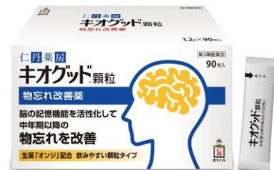
「キオグッド® 顆粒」(価格:5,400円/税抜)

「キオグッド® 顆粒」は記憶機能を活性化することで物忘れを改善する作用が認められた“イトヒメハギの根(生薬名オンジ)”を配合した第3類医薬品です。さらさらの飲みやすい顆粒タイプの生薬で、物忘れを改善しアクティブな生活を送りたいと願う方を応援します。