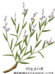
イトヒメハギ 根を乾燥させたものがオンジです。