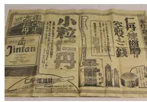
歴史保存事業でお客様から寄せられた「仁丹にまつわる思い出の品」 (左)仁丹30段新聞広告(昭和2年) (右)仁丹配達用 自転車かご