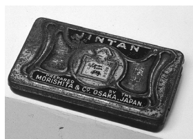
仁丹創売当時の 1粒出しケース (明治38年)