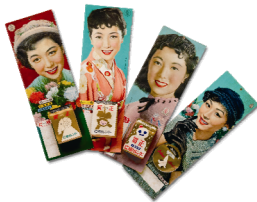
お客様用カレンダー 女優の白鳩真弓さんを 起用(昭和20~30年頃)