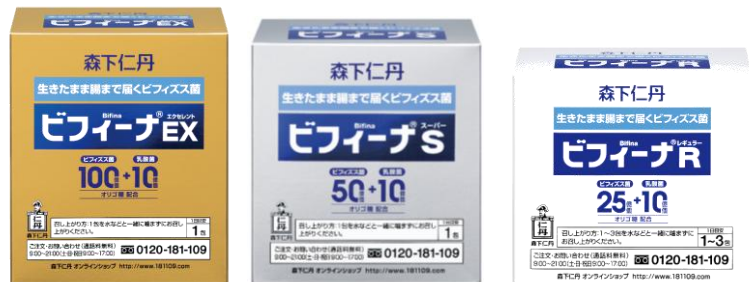
「ビフィーナ」シリーズ 商品ラインナップ(一部)

★ビフィズス菌を空腹時に相当する人工胃液 (pH1.2) 中に入れ、2時間後の生存菌数を日本薬局方外医薬品規格「ビフィズス菌」の定量法により測定し、生存率を算出 (仁丹バイオファーマ研究所調べ) ※ビフィズス菌は当社原料である Bifidobacterium longum JBL01株を使用。