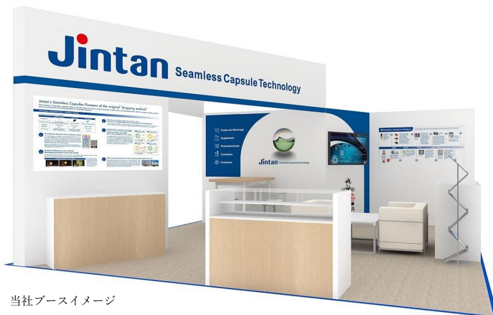
当社ブースイメージ

今回のブースでは、多くの知見と豊富な実績を持つ当社のシームレスカプセル技術について展示を行い、その多様性と汎用性を幅広く情報発信いたします。