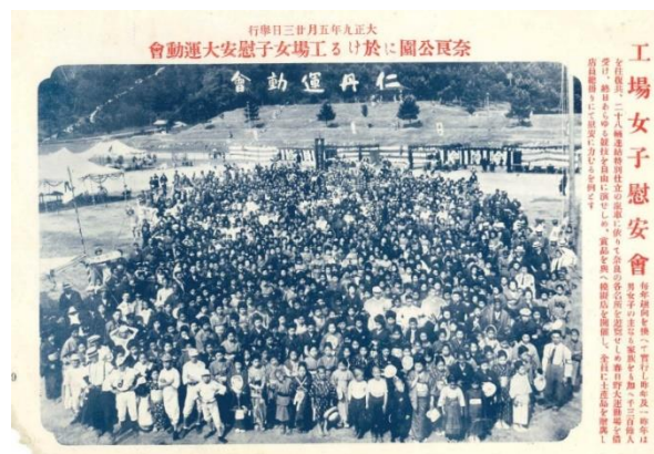
▲従業員は家族であるという“家族主義”の考えのもと女性従業員とその家族を招待して開催された社内行事（大正時代）